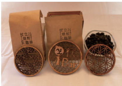
オススメお土産 コーヒー豆・コースター

杖立温泉にあるゆる〜いバー。元寿司屋の店舗をリノベーションした昭和感たっぷりの店内で、杖立温泉の湯けむりや杖立川の風景を楽しみながらお酒や夜カフェを堪能できます。お土産には自家焙煎したコーヒー豆や、デザイナーでもある店主がデザインした小国杉の木工コースターがおすすめです！