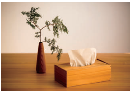
オススメお土産 家具・小物

触れた瞬間、幸せオーラが出てしまう家具を製作しています♪なめらかな手触りと艶、美しい曲線は飽土上げという手仕事によるものです。樹齢100年程の小国杉が持つ圧倒的生命感を120%引き出しています！オーダーメイドのご注文を承ります。お気軽にお問い合わせください。