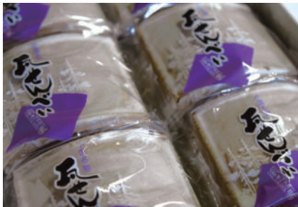
オススメお土産 瓦せんべい

小国町役場近くに位置する、桃色店頭幕が目印の瓦せんべい専門店。サクサクと軽やかな食感と上品な甘さが特徴で、ほんのりと香る生姜が味のアクセントになっています。ひとつひとつ手作業で焼き上げられた、地元へ愛される小国の銘菓です。販売は店舗のみですが、お電話でのお取り寄せも可能。