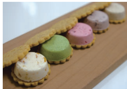
オススメお土産 MYSA ミーサ (マイバターサンド)

地元食材を中心に、ジャージー牛乳や有精卵・キビ砂糖や甜菜糖など素材にこだわり製造。小さな工房で丁寧に手づくりされた無添加で身体に優しいお菓子が楽しめます。小国ジャージーバターサンドは「フード・アクション・ニッポンアワード2018オンワード賞」を受賞。通販サイトからも購入可能です。