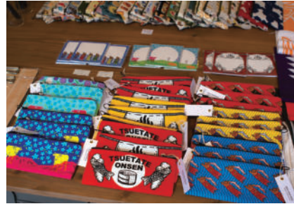
オススメお土産 ペンケース

杖立温泉に位置する郷土文具に特化した文具店です。「郷土文具?」と不思議に感じる人も多いはず。郷土文具とは、その土地でものづくりに携わる人々と共同でつくる新しい文具を意味します。面白い文具も目を惹きますが、お土産にはオリジナルの杖立温泉手ぬぐいやペンケース等がおすすめ。