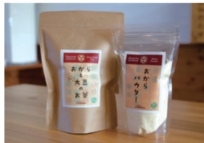
オススメお土産 おからと大豆のお茶 おからパウダー

農業と福祉を繋ぎ合わせた地域密着型レストランです。人気メニューのおか牛のどんぶりセットをはじめ、耕作放棄地を活用し栽培した希少大豆「すずかれん」など地元食材を提供しています。人気の「おからと大豆のお茶」は香ばしい風味とまろやかな口あたりで、身体にやさしいホッとする味わい。