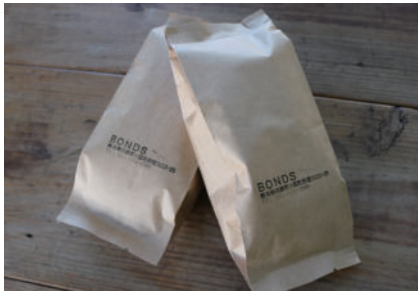
オススメお土産 コーヒー豆

店主がくぬぎ林を購入し、自力で伐採・造成・建築されたこだわりの店舗です。カフェメニューも豊富でスパイスカレーや、自家製スイーツなどが楽しめます。中でも酸味と苦みのバランスが良い「自家焙煎珈琲」はクリアな味わいで何度でも飲みたくなる味です！コーヒー豆の販売は予約・発送可能。