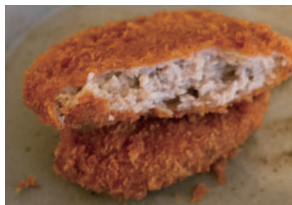
オススメお土産 メンチカツ

九州産黒豚のみを販売する「黒豚精肉専門店」です。豚肉のこなら黒豚屋!と地元で愛される名店で、長年の知識と経験を活かして厳選された九州産黒豚はどれも絶品。その中でもおすすめの、ジューシーなメンチカツです!サクッとした衣と、ジューッと中から溢れ出る肉汁がたまりません。