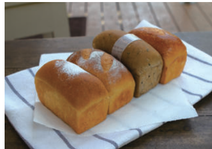
オススメ土産 クリームパン・紅茶のクリームパン チョコレートクリームパン 抹茶クリーム・小豆のクリームパン

初めて来られる方は「え?ここがパン屋さん?」と言ってしまような、森の中に佇む人気ベーカリーです。おすすめはクリームパンで、カスタードだけでなくチョコレートや抹茶・紅茶など種類が豊富。くちどけの良いクリームのお味いと、心地よい小麦の風味が鼻に抜け、思わず顔がほころびます。