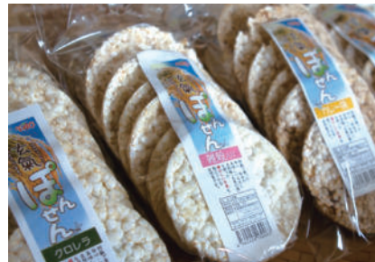
オススメ土産 玄氣ぼんせん・地熱乾燥菊芋チップス 菊芋パウダー・菊芋茶・樹上完熟梅干し

リトリートセンターと健康セミナーを運営しながら、オーガニック食品の加工をしています。オススメは、無農薬米と天日自然塩を使用した無添加の「玄氣ぼんせん」と地熱乾燥の菊芋商品類です。健康にも環境にも優しく、美味しい「懐かしい未来食」をテーマにしています。