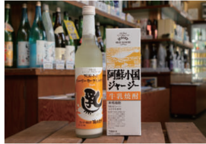
オススメ土産 キクイモチップス・キクイモパウダー キクイモ三年番茶 地熱乾燥りんごチップス

1873年創業の地酒や地焼酎、ご当地ワインや地元産物を販売するアットホームな酒屋です。おすすめはジャージー牛乳の焼酎やジャージー牛乳のヨーグルトのリキュール。特産品「キクイモ」を使った加工品や、温泉地ならではの「地熱」を活用した商品など、一味ちがった小国土産が揃うのも魅力です。