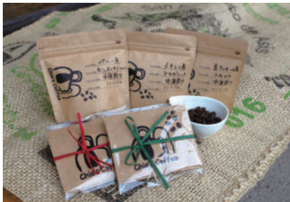
オススメ土産 コーヒー豆

「小国町にはコーヒー豆を買えるお店がなかった。」という理由がきっかけで、なんとお店を始めることになったそう! どんな人にも飲みやすいコーヒーを提供したいという想いで、癖のないスッキリした味わいのコーヒーを提供。手摘みの完熟豆を小国町の小さな焙煎所で丁寧に自家焙煎しています。