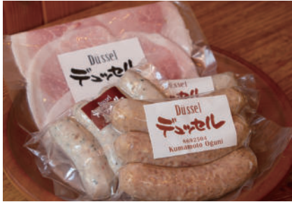
オススメお土産 ソーセージ・生ハム

ハム・ソーセージの専門店。店主は単身ドイツに渡り、修行の末にマイスター（ドイツ国に認められた称号）を取得。対面販売を大切に、地元小国町で開業されました。ショーケースにはソーセージやハム・ベーコンが並び、目移りしてしまいます。特に「しいたけグリラー」は小国土産にもぴったり！