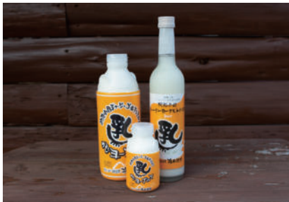
オススメ土産 ジャージーのむヨーグルト

「梅田牧場」直営店舗。澄んだ空気と大自然に恵まれた牧場で、土づくりからエサづくりまでジャージー牛一筋にこだわる牧場を営んでいます。安心して新鮮な手づくり商品が魅力で、飲むヨーグルトとヨーグルトリキュールは小国土産にぴったり。ミルク本来の優しい甘さと濃厚なコクが病みつきに!