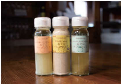
オススメお土産 おぐにドレッシング

「あか牛肉料理認定店」レストランです。ヘルシーで美味しいあか牛のステーキやハンバーグをリーズナブルに提供。店舗でも使用される「おぐにドレッシング」は根強いファンが多く、お土産としても大人気！新鮮な素材を丁寧に手づくりされており、カボス・ゆず・たまねぎの3種類から選べます。