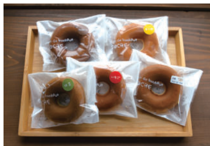
オススメお土産 焼きドーナツ

小国の清らかな水を使用した水出しコーヒーやジャージーソフトクリーム・手づくりお団子など、旅の合間にゆっくり楽しめる甘味処。中でもおすすめの「焼きドーナツ」です。味は全5種類。ふわふわ食感としっとりした焼き加減がやみつきに。個包装で配りやすいのお土産に嬉しいポイント!