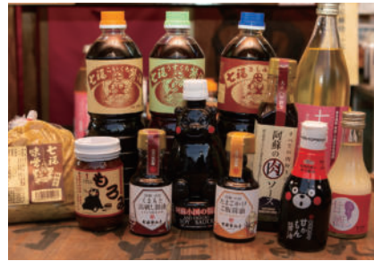
オススメお土産 各種醤油・阿蘇の肉ソース 湯けむり甘酒など

創業100余年。長年、小国郷の旅館(杖立温泉・黒川温泉)や地元の方々に愛される老舗醤油屋です。天然湧水で造ったこだわり醤油はコクと旨味があり料理に欠かせません。他にも醤油だけではなく、お味噌や加工品があり、特にお肉に合う「阿蘇の肉ソース」はキャンプやご家庭用に人気の商品です。