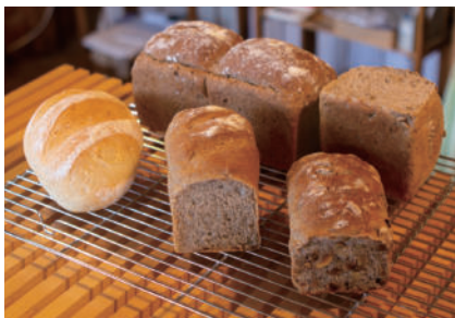
オススメお土産 ヴァイツェンブロード(白パン) ライ麦パン(黒パン)・ミルクパン各

店主は単身ドイツに渡り、マイスター(ドイツ国に認められた称号)を取得。本格的なドイツパンが楽しめる評判のベーカリーです。店内にはライ麦の芳醇な香りが漂い、食欲をそそられます。クリスマスにはフルーツケーキ「シュトレン」が販売されるので、毎年心待ちにしているファンも多数!