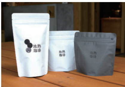
オススメお土産 コチャパンパ(ペルー)

わいた温泉郷に位置し、地熱(温泉蒸気)を活かした製法で世界唯一の珈琲提供店。地熱を使い沸かしたお湯で珈琲生豆の汚れを洗い落とす50℃洗いした後、地熱で蒸し上げて焙煎を行います。丁寧に焙煎された地熱珈琲は雑味・えぐみ・苦味のない、まろやかな口当たりですっきりとした味わいです。