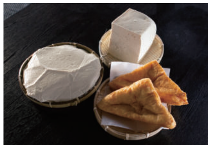
オススメお土産 ざる豆腐・田舎豆腐・あげ

明治創業、小国町の山あい位置する老舗豆腐店です。わいた山の伏流水を使って丁寧な手仕事で作られる、素朴な味わいが人気の秘訣。昔から変わらぬ味を求めて、遠くから足を運ばれる方も多です。お土産にはざる豆腐や田舎豆腐、あげがおすすめ!商品はお待ち帰りだけでなく宅配発送も可能。