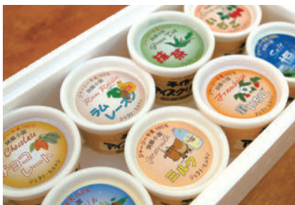
オススメお土産 ジェラート

昭和48年創業、大きな風車が目印ドライブインです。リーズナブルなあか牛丼の他、阿蘇小国ジャージー牛乳100%の手作りジェラートが人気!コクがありながら後味はさっぱり。くちどけの良いリッチでクリーミーな味わいが特徴です。定番商品から季節限定商品まで10種類以上。全国発送も可能です。