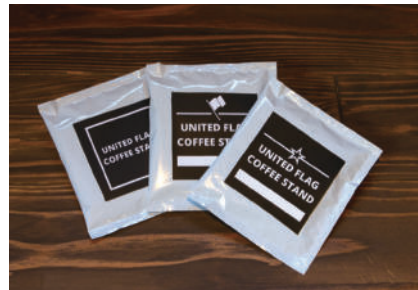
オススメお土産 ドリップバッグ

わいた温泉郷に位置し、蕎麦屋「和の花」が営むお洒落なコーヒースタンド。「フレンチプレス」のコーヒーで、豆の味や香りをダイレクトに味わうことができるのが特徴です。コクのある深煎りコーヒーが人気。自宅でも手軽にお店の味が楽しめるドリップバッグはお土産にもぴったりです！