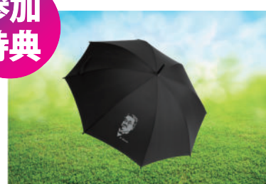
記念傘プレゼント